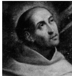
Johannes af Korset (1542-1591)

Lad intet forvirre dig. Lad intet skræmme dig. Alt forgår. Gud forandrer sig aldrig. Tålmodighed opnår alt Den som har Gud, vil opdage, at intet mangler. Gud alene er nok.