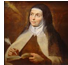
Teresa af Avila (1515-1582)

Eftersom Jesus blev taget op i himlen, kan jeg kun følge Ham ved hjælp af de spor Han har efterladt, men hvor disse spor dog lyser, hvor de dufter! Jeg behøver kun kaste et blik på Det Hellige Evangelium, så indånder jeg øjeblikkelig duften af Jesu liv, og jeg ved til hvilken side jeg skal løbe...det er ikke den øverste plads, men den nederste plads, jeg skynder mig hen til.