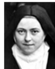
Therese af Lisieux (1873-1897)