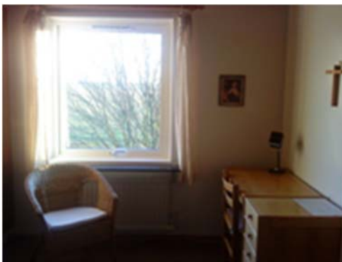
Retrætehuset i Norraby

Undervisningen omfatter herudover skriftlig kommunikation med lederen af oplæringen.