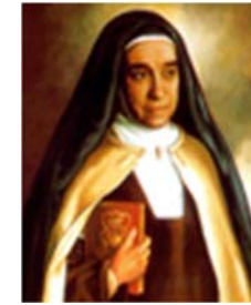
Maravillas af Jesus (1891-1974) Helgenkåret 2003

Hvilken rigdom har Herren givet mig i dette kamelitiske liv! Alt i det er ordnet med en sådan enkelhed, ja i den grad, at jeg ved at leve det i dybden ville være i stand til alt.